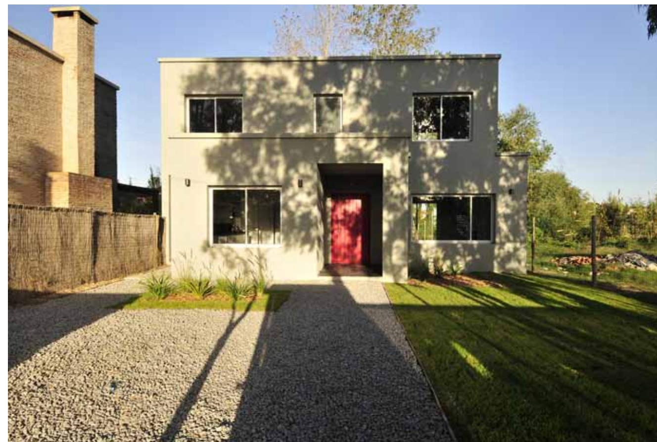
CASA EN LAGOS DE CARRASCO // Ubicación: lagos de carrasco, Montevideo / Año: Superficie: 210m2 / Programa: Residencia Unifamiliar / Proyecto: Arq. Agustina Mercader.

La obra que seleccionamos para publicar con la presente edición es una vivienda unifamiliar, living-comedor, estar cocina y servicio, tres dormitorios principal en suite. Se trata de un emprendimiento inmobiliario, razón por la cual el habitante es anónimo. En consecuencia la Arquitecta trabajó con la libertad y la información de mercado del caso. En principio el habitante destinatario es una familia. El paisaje circundante que propone el lugar es impresionante, fondo a un enorme lago navegable, con una dinámica entre vegetación y distintas especies de aves, peces, etc que habitan el lugar, los reflejos de luz y cambios de tonalidades que siempre existe cuando hay un espejo de agua. Todos los materiales de la construcción son cerámicos (techos y paredes) pisos de piedra, materiales nobles fabricados en Uruguay, aberturas de aluminio que garantizan buena aislación térmica