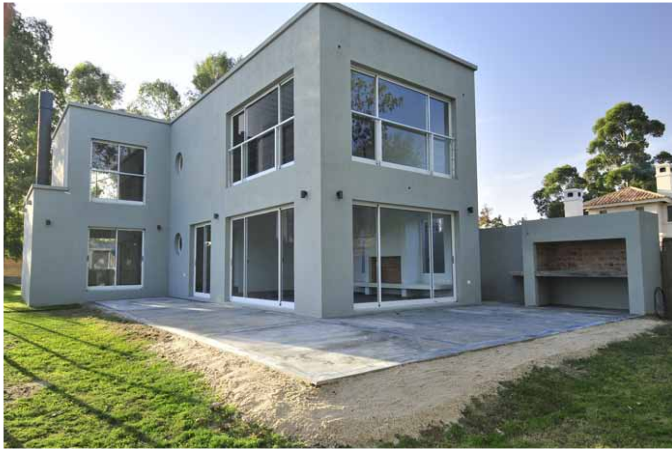
CASA EN LAGOS DE CARRASCO // Ubicación: lagos de carrasco, Montevideo / Año: Superficie: 210m2 / Programa: Residencia Unifamiliar / Proyecto: Arq. Agustina Mercader.